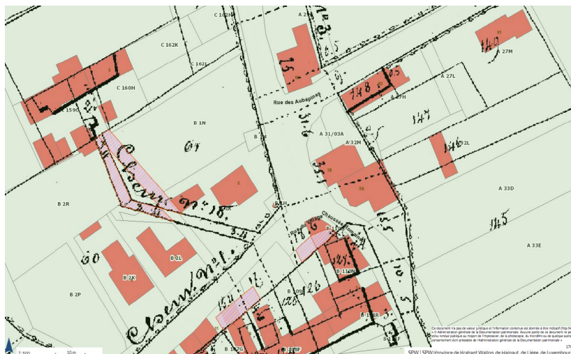
Carte communale de référence.

s'intégra dans l'équilibre voyer du village et se couvrit dès 1860 d'habitations d'artisans (un menuisier, un maréchal-ferrant, un tailleur de pierre); la Rue du Village (chemin n°1) devint l'artère principale et l'ancienne liaison vers la Rue des Cortis disparut dans un champ.