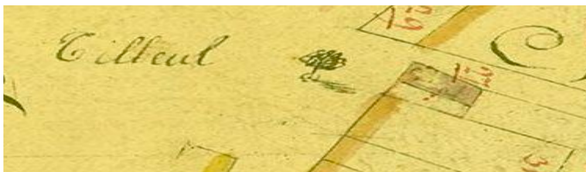
Plans Primitifs de Ramelot (Archives de l'Etat à Liège)

La carte de Ferraris ne montrait aucune construction sur la Chaussée romaine à proximité du carrefour formé avec l'axe reliant Abée et le tige de Vyle, qui étaient donc au même niveau. Comment était-ce possible au vu de l'encaissement actuel ? Le tracé de la chaussée (3,5 m. de large) escaladait l'ondulation du tige 25 m. à l'est de l'actuel (du côté d'Abée) et passait entre le tilleul et la première maison de la Rue des Aubépines (n°93; 27 sur la carte). Le carrefour se trouvait donc au niveau du pied du tilleul et de la cabine électrique sur l'autre côté de la route. Quant au tilleul, il est représenté sur les Plans Primitifs (établis en 1829) au milieu de l'espace libre. Cet espace d'une trentaine de mètres de large et légèrement incliné vers Ramelot constituait-il une place autour du tilleul ou simplement une "terre vaine"?