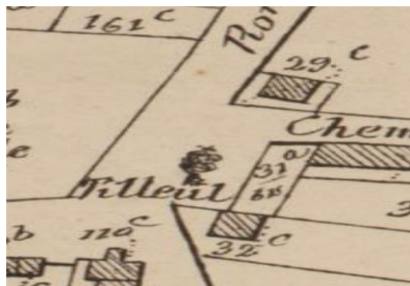
Plans cadastraux de Ph. Popp (avant 1869)

Les premières constructions apparaissent sur le tronçon désaffecté du chemin n°3.