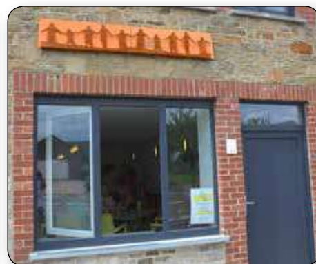
Rue Malplaquaye, le local intergénérationnel s'est doté d'une frise symbolisant l'intergénérationnel.