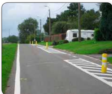
Suite aux réunions de village sur la sécurité, des aménagements réalisés à Coënhez pour ralentir la vitesse des automobilistes. Des marquages au sol, rue de l'église, pour permettre l'arrêt des bus.