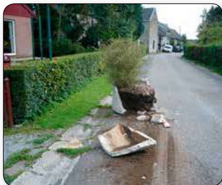
L'entreprise de formation par le travail «Côté Cour» a remis en état une vingtaine de potelets cassés dans l'ensemble des villages.