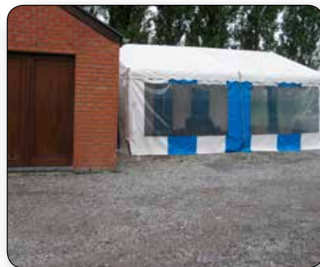
Avant la rentrée, les ouvriers ont terminé les aménagements de l'école : goals pour les 3 terrains de foot, marquage au sol des zones de la cour, porte vélos, barrière de sécurité en haut des escaliers du nouveau bâtiment., réparations diverses ... Ils ont monté et démonté de nombreuses fois les chapiteaux communaux au profit des organisateurs d'activités : fêtes d'école, de village, manifestations sportives et culturelles ...