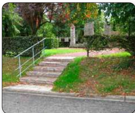
Subsidés par la Région, les travaux d'aménagement de la place de Seny sont terminés. La rampe et l'escalier permettent un accès plus aisé pour tous.