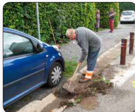
Il faut entretenir également les fossés, les avaloirs...