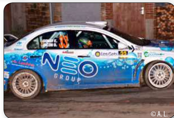
Un membre du personnel communal et 3 équipes de jeunes Tinlois participaient à ce rallye. Tous termineront la course fièrement !