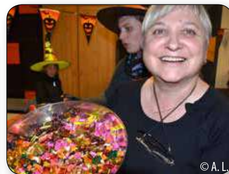
Le 30 octobre, ce sont les enfants de l'école Ste Reine qui se promenaient en cortège dans le village. Les résidents de la Séniorie les ont accueillis avec joie et avec des friandises !