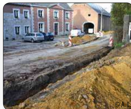
A Seny, la CIESAC (Compagnie Intercomm des eaux de la source des Avins) a prolongé une conduite d'eau dans la rue Hayouille.