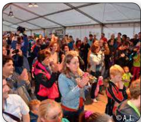
Applaudissements nourris du public pour féliciter les sportifs