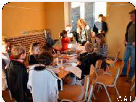
Avant de partir sonner aux portes, les enfants de Ramelot ont préparé masques et déguisements dans la salle, avec l'aide de plusieurs parents.