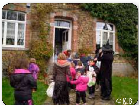
Les enfants, qui vont à l'accueil extra scolaire ont sillonné les rues de Soheit-Tinlot. Les habitants leur ont bien vite ouvert la porte sous la menace du slogan «des chiques ou la vie !»