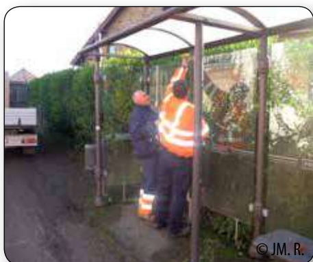
A Soheit-Tinlot, les ouvriers communaux ont réparé l'abri bus vandalisé de la rue Malplaquaye.