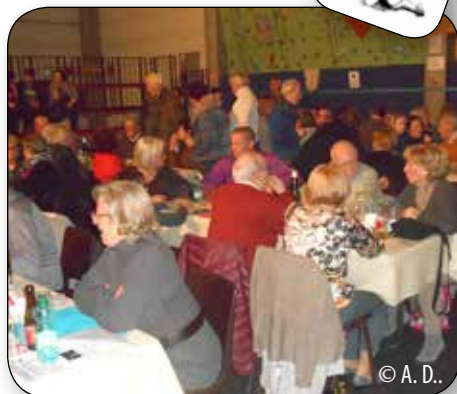
La salle aménagée «ambiance cabaret»!