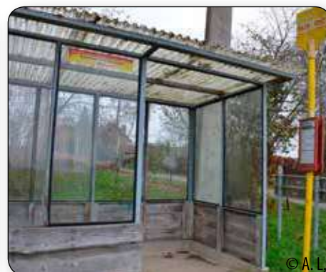
A Abée, celui de le rue Botteresse sera bientôt remplacé.