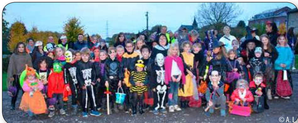
A Scry, tous sont prêts pour le départ dans les rues du village. Tout au long du trajet, la brouette se remplit de chiques qui sont ensuite partagées entre les enfants

A Scry, à Ramelot, à Récréa+, à l'école Ste Reine... les enfants nombreux, effrayants et en cortège ont frappé aux portes et ont récolté des chiques auprès des généreux habitants.