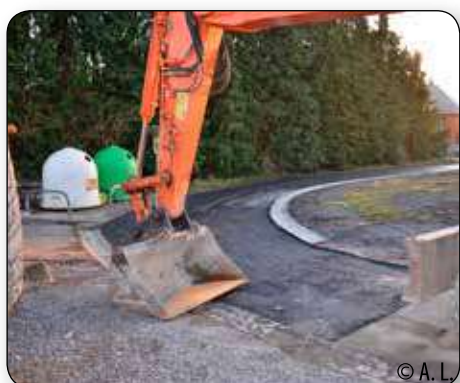
A Soheit-Tinlot : réfection du Chemin de messes, côté cimetière par la société Pierre Frère et Fils.