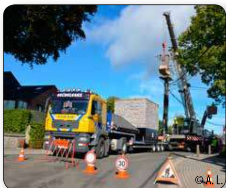
A Ramelot, ORES a installé une nouvelle cabine électrique près du monument pour, à long terme, supprimer le gros poteau électrique du carrefour.