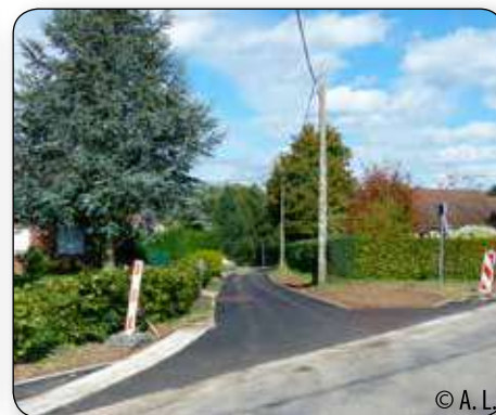
Le chemin des Sarts qui mène aux 6 logements est réparé.