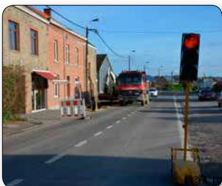
Avant l'hiver, l'entreprise Legros a terminé la réfection du trottoir Rue du Montys.