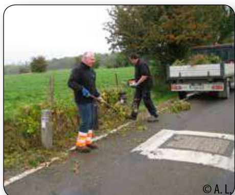
En automne, c'est la période de taille des haies et de l'entretien des ouvrages de sécurité