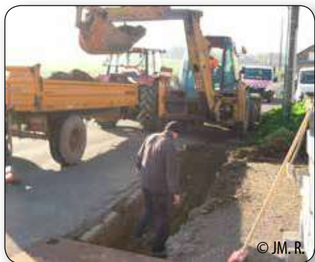
A Fraiture, Rue Bouhaye et Tige de Favennes : mise en place de filets d'eau par les ouvriers communaux et l'EFT Cour et jardin.